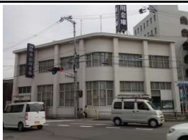
京都中央信用金庫 徒歩1分(60m)