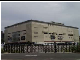
BiVi二条(複合商業施設) 徒歩5分(330m)