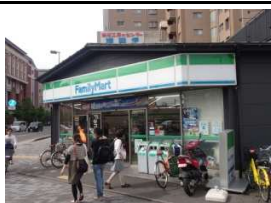
ファミリーマート 徒歩1分(80m)