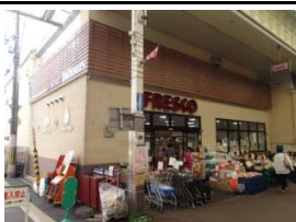
スーパーフレスコ 徒歩2分(140m)